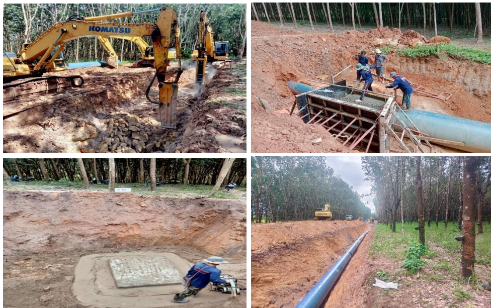
รูปที่ 1.7-1 ความก้าวหน้าการก่อสร้างระบบท่อส่งน้ำพร้อมอาคารประกอบฝั่งขวา